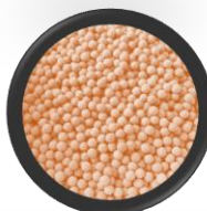
サンゴミネラル溶出ボール